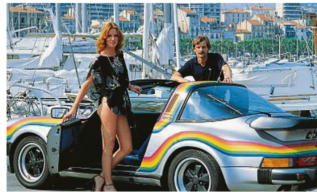
Den Porsche Turbo Targa Regenbogen gibt es nur einmal auf der Welt. Er kommt im Film vor.

Harry König hatte früher mit seinem Sex-Appeal Frauen wie Brigitte Bardot und Romy Schneider rumgekriegt. Nach seiner Läuterung machte er in Immobilien,