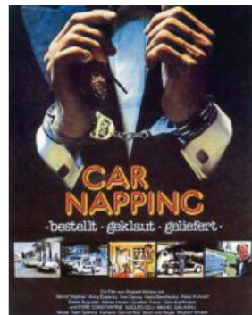
38 Millionen Menschen sahen „Car Napping“.