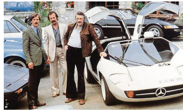
Auch der Mercedes CW 311 spielt eine Hauptrolle in „Car Napping“. Heute gehört er dem Sultan von Brunei.

Mode, Kunst, Diskotheken und Fußball. Einst schwamm er im Geld, am Ende strandete er. Von seinen Kontakten aber lebt der 77-Jährige noch heute. Genau wie von seinen Erinnerungen, die er gerade für „Car Napping 2“ aufschreibt. Er plaudert gern über alte Münchner Zeiten. Dort möchte er bald wieder leben, sagt er. „Ich suche nach einem Apartment – ich möchte wieder mittags am Viktualienmarkt sitzen.“